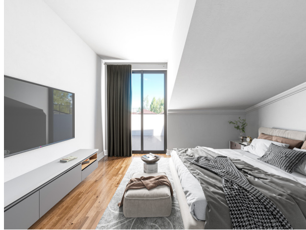
Dubleks kat yatak odası