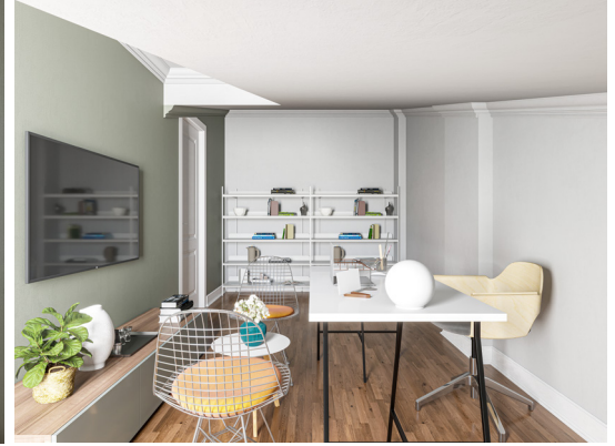
Dupleks kat toplantı odası