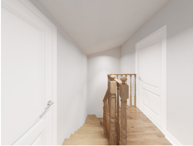
Dubleks kat antre