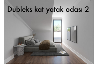
Dubleks kat yatak odası 2