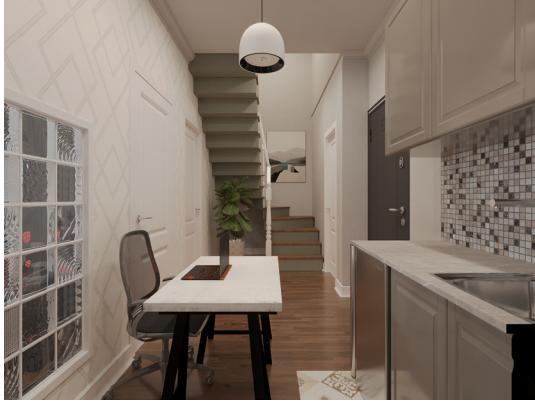
Sekreter ve Dupleks Çıkış