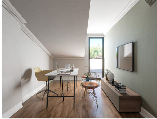
Dupleks kat toplantı odası