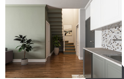
Antre ve Dubleks Çıkış