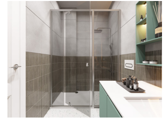
Dubleks kat duş-WC