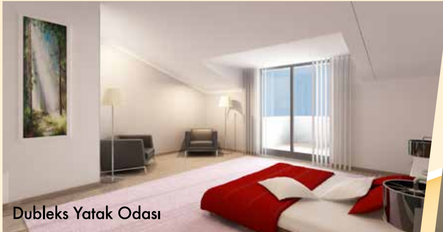
Dubleks Yatak Odası