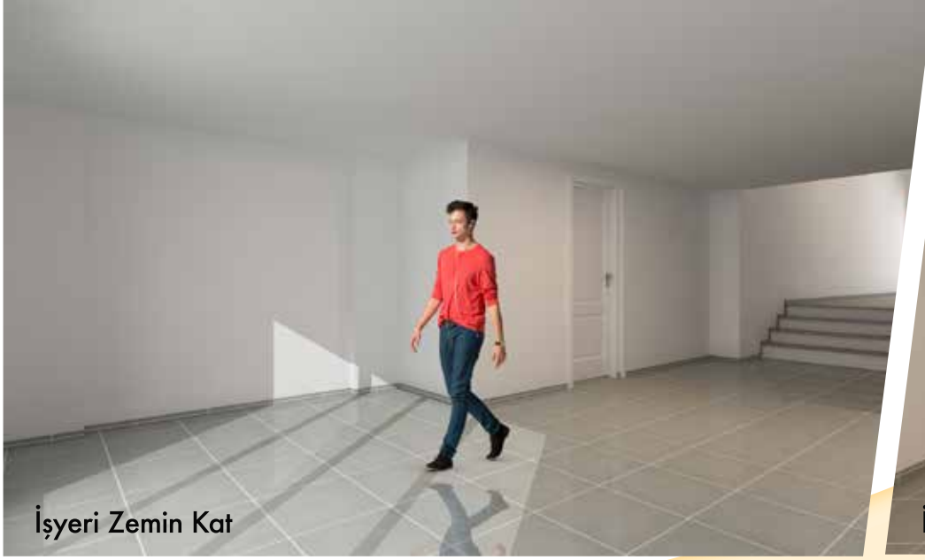
İşyeri Zemin Kat