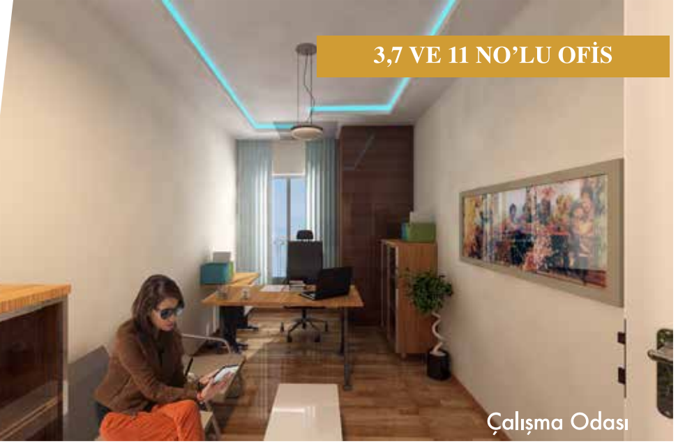
3,7 VE 11 NO'LU OFİS