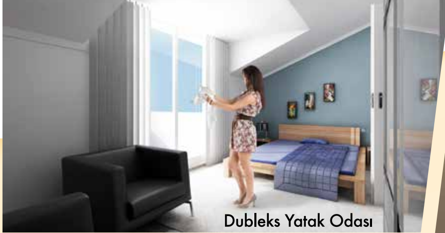
Dubleks Yatak Odası