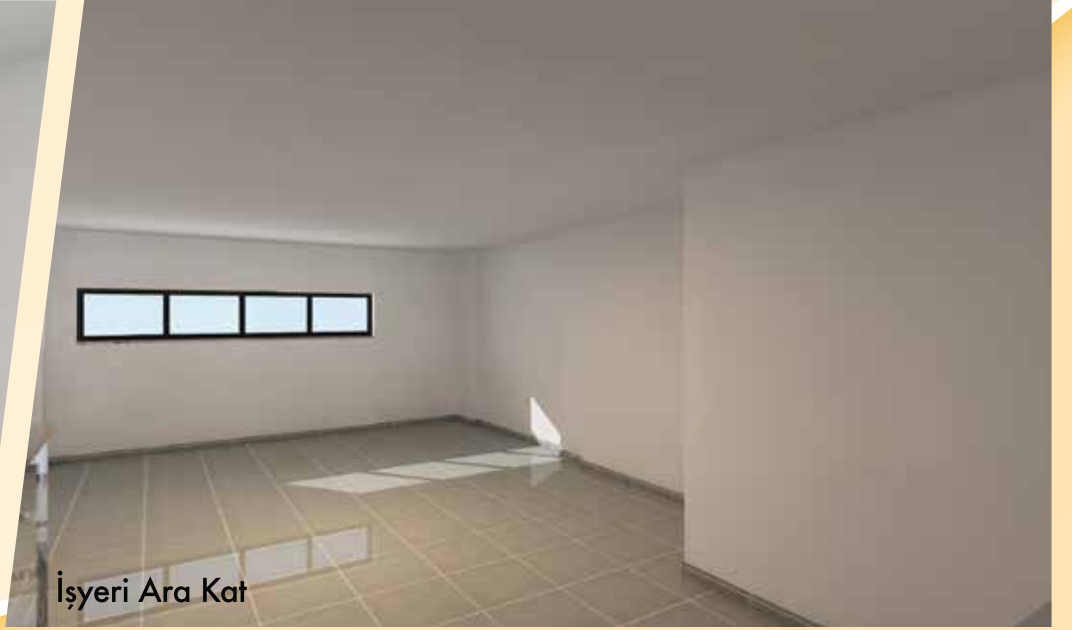
İşyeri Ara Kat