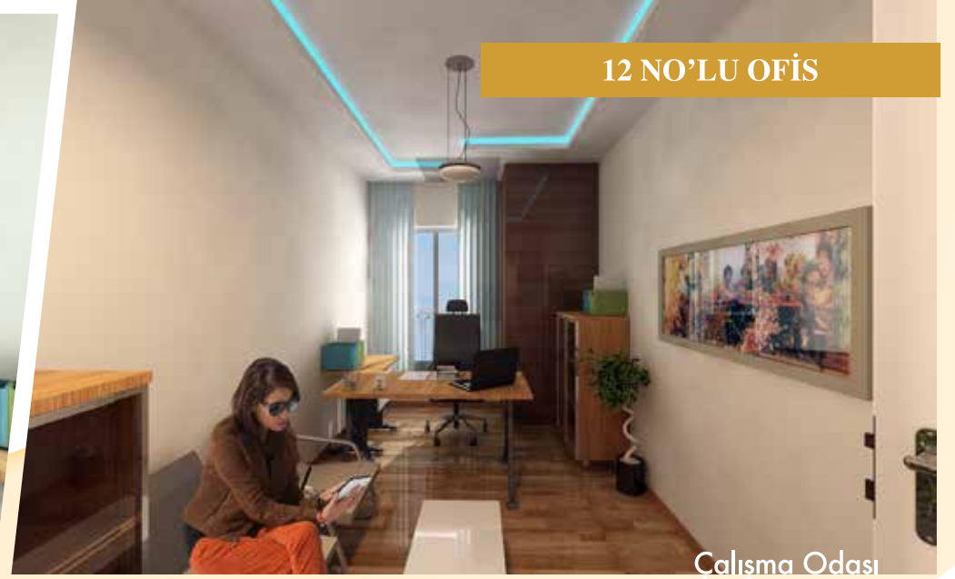
12 NO'LU OFİS