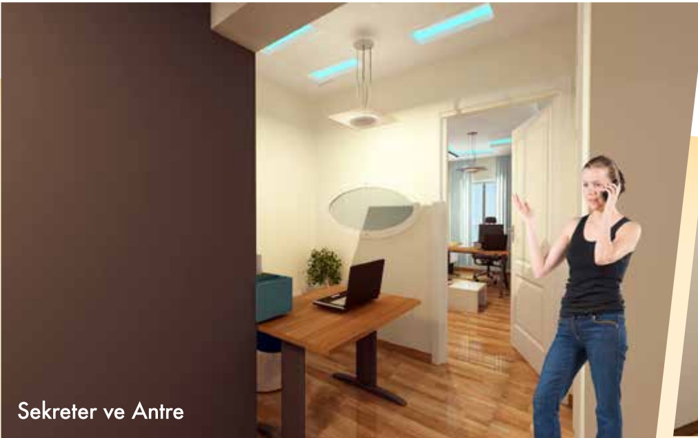
Sekreter ve Antre