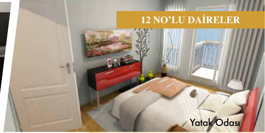
12 NO'LU DAİRELER