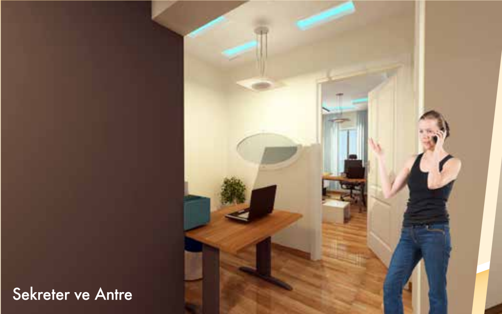
Sekreter ve Antre