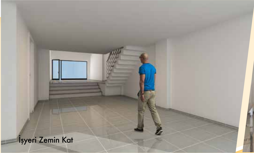
İşyeri Zemin Kat