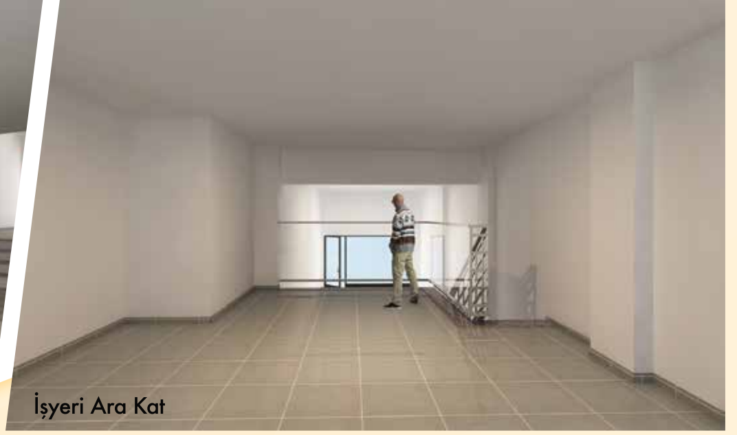
İşyeri Ara Kat